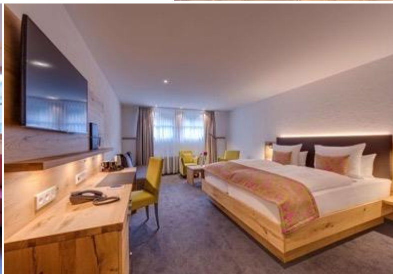
พักที่ Hotel Hofgut Sternen หรือเทียบเท่าระดับ 4 ดาว